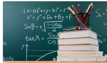
Das Physik Lernzentrum öffnet seine Türen!