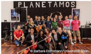
Physikshow-Musical PLANETAMOS unterhält Publikum