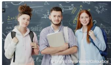
NEU: Projekt ProMaster